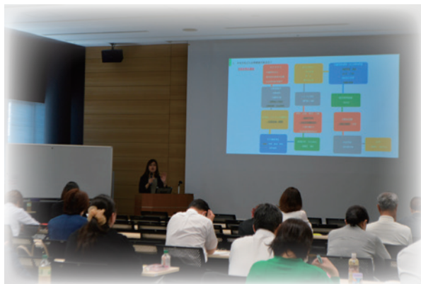
社会保険事務研修会