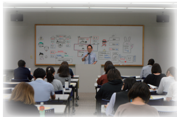
社会保険事務「基礎講座」