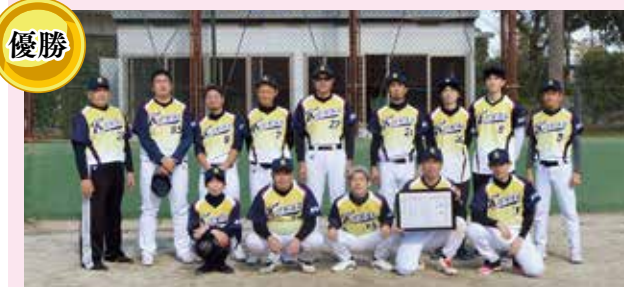
社会福祉法人 更生会