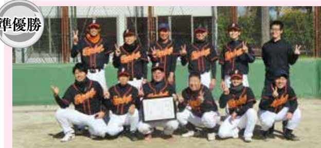
株式会社 芙蓉商事