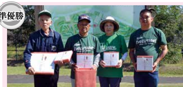
株式会社 森栄生コン